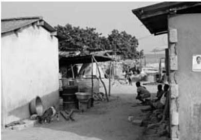
Wohnen in Ghana