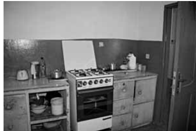
Küche der Schule in Ghana