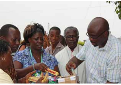
Verteilung der Geschenke aus der Schweiz