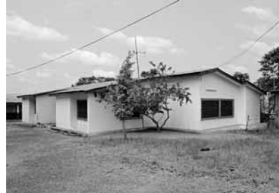
Schule für geistig behinderte Kinder in Ghana

mentally challenged children» wurde bereits in einem früheren Heftli thematisiert. Allerdings bedürfen diese Menschen immer noch unserer Hilfe und sind für jede Spende enorm dankbar.