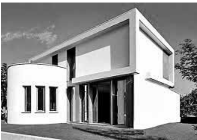
Wohnen in der Schweiz

Benedikt erzählt von einem Land, das mit der Schweiz nicht vergleichbar ist. Seine geschossenen Fotos, so meint er, zeigen in keinsten Weise die Hilflosigkeit und Dürftigkeit an diesem Ort. Doch obwohl die Menschen nichts haben, so geben sie alles. Überall auf ihrer Reise wurden sie mit offenen Armen empfangen und die Herzlichkeit durften sie mit jeglichen Bekanntschaften erfahren.